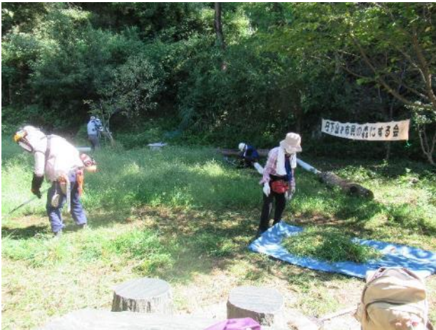
除草と後片付けにひと汗