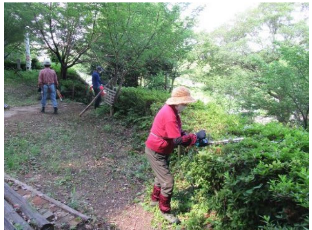
ツツジの剪定手入れ