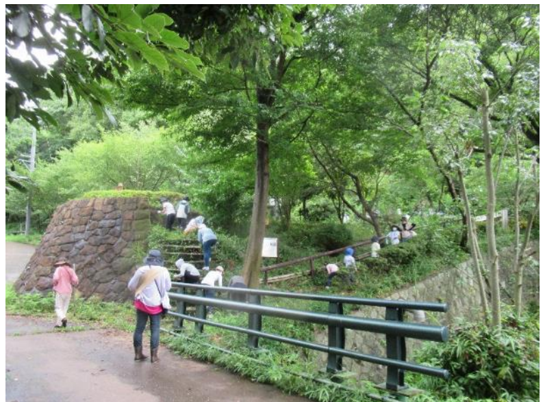
ガールスカウトの参加による遊歩道の清掃