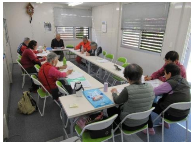
作業を終えて、天女が池レストハウスで役員会