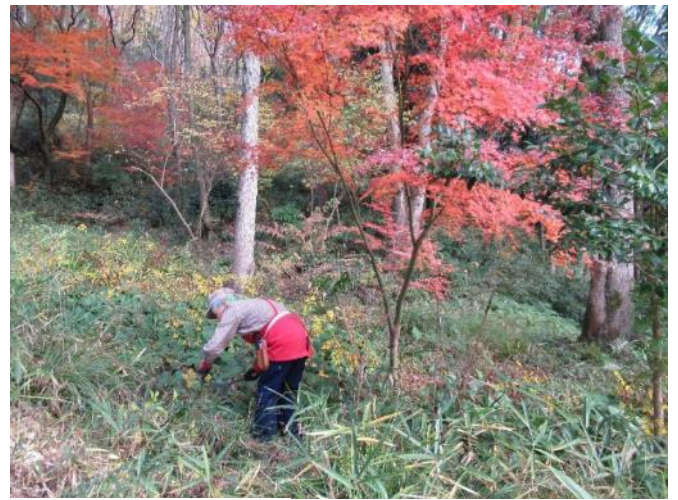
日下山を彩る、春はサクラ & 秋はカエデ