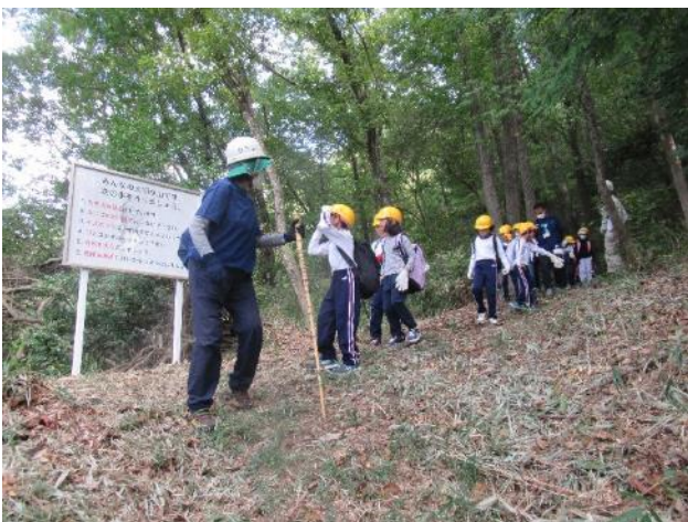
孔舎衛東小学校 3 年生環境学習 日下山の散策