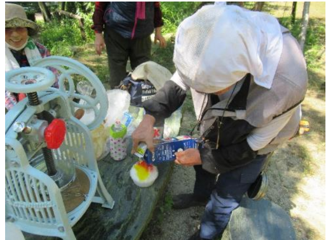
夏場には、かき氷の嬉しい差し入れ