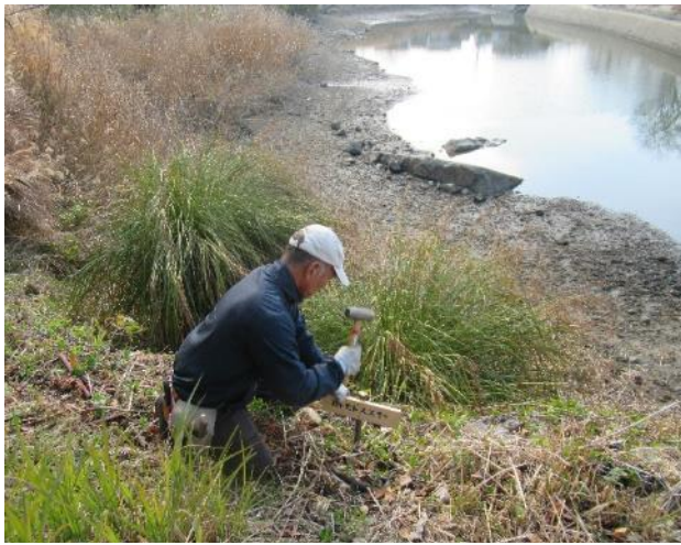
ヒトモトスキの表示板の設置