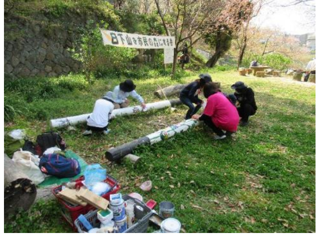
ガールスカウトによる記念ポールの作成