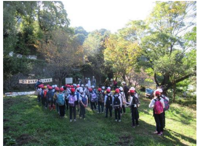
孔舎衛東小学校 3 年生環境学習