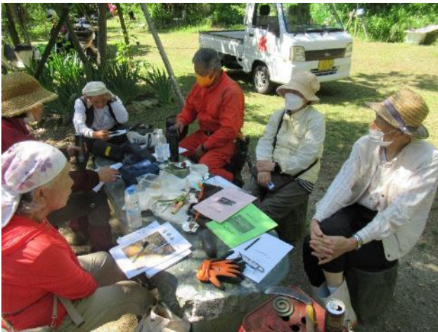
20周年記念誌の構想話し合う