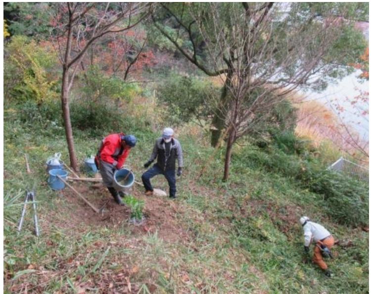
除草、整地して植栽