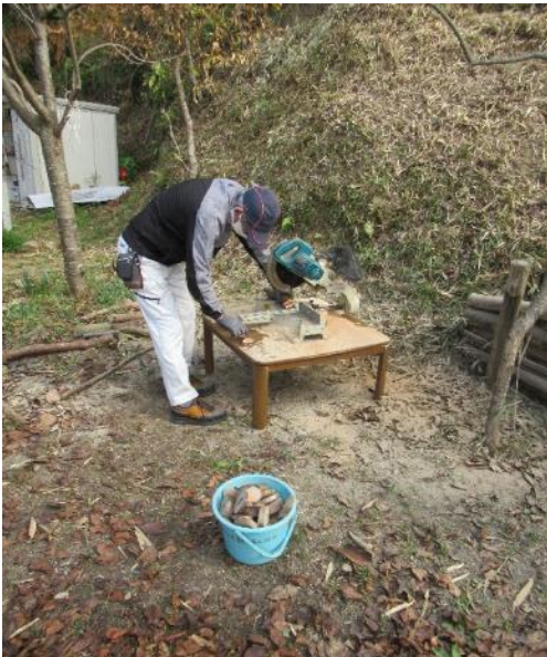
クラフト用材づくり