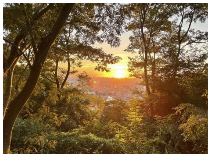
見晴台からの景色も最高！ 夜桜とボンボリ & 夕日と大阪平野