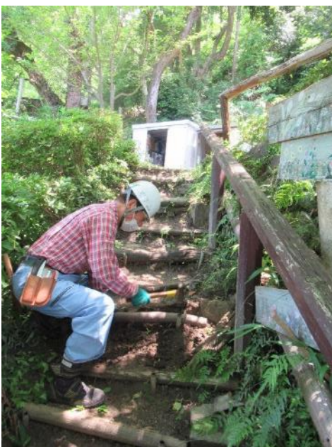
遊歩道の階段補修