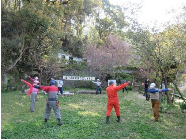
作業前のラジオ体操