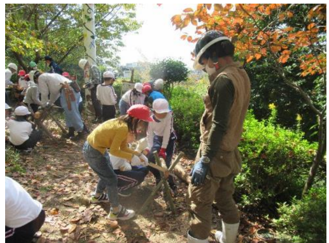
孔舎衛東小学校 3 年生環境学習 ノコギリ体験