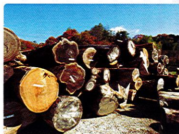
奈良市小倉 貯木場