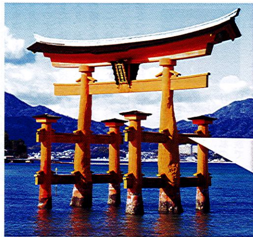
広島県 厳島神社 大鳥居