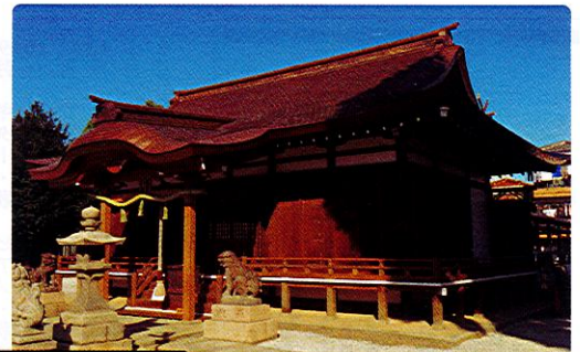
東大阪市 御厨天神社

世界の建築物はその国のもつとも手に入りやすい材料で建てられている。気候風土に合いメンテナンスもし易く合理的である。日本古来から大事に扱われてきた神社・寺院や、古民家の復元と修理などで、素材はほとんど木材である。宮大工の仕事は市